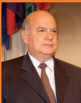
SECRETARIO GENERAL José Miguel Insulza