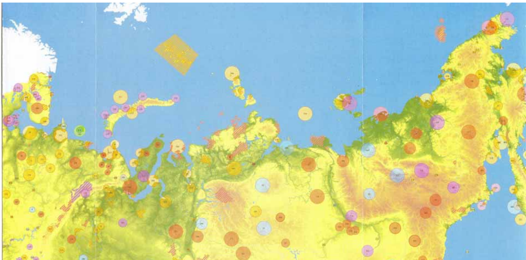
Рис. 2. Существующие (заштрихованы) и предлагаемые перспективные (круги) особо охраняемые природные территории российской Арктики (из: Особо охраняемые..., 2009)