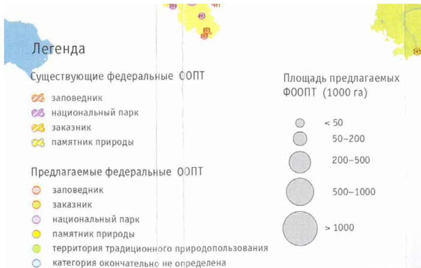
Легенда к рис. 2.