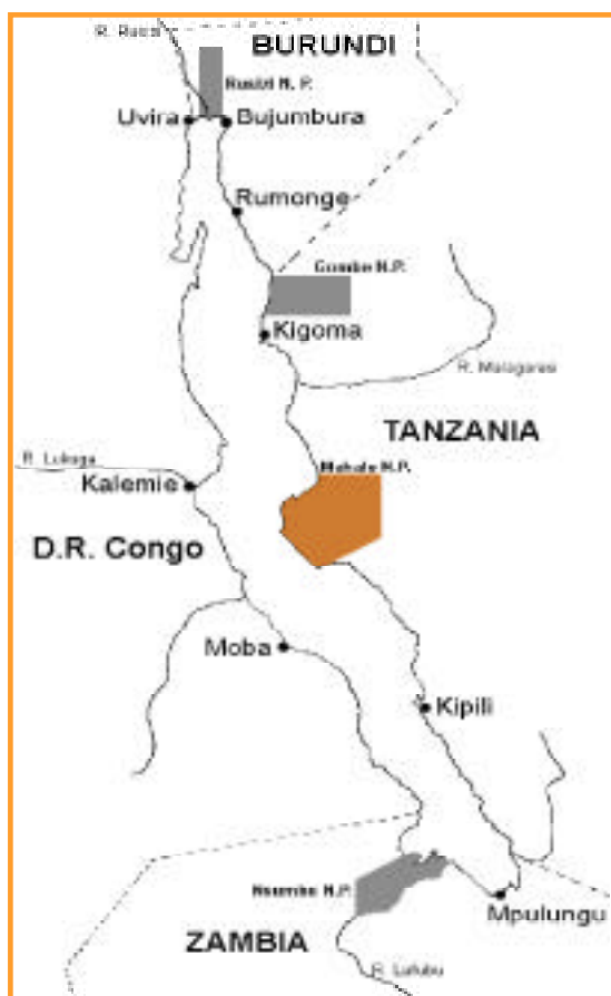
Emplacement du P. N. Mahale (orange) au lac Tanganyika (modifié à partir du croquis du Coulter et Lowe-McConnell, Novembre 1995)

Le deuxième couple de plongeurs a effectué l'inventaire des mollusques, en suivant la ligne transversale établie par l'équipe précédente. Les plongeurs ont travaillé à 25 m, 15 m, 5 m et ont utilisé le masque et tuba entre 0-2 m. A chaque profondeur, les