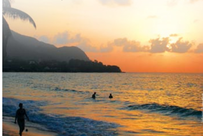
David Vousden Director: ASCLME Project

In the following pages, we have highlighted some of the many activities funded and supported by the ASCLME Project since 2008. All of these activities have required time, energy and commitment from the countries of the western Indian Ocean and a wide range of partners and stakeholders who have collaborated with the Project to promote enhanced understanding and sustainable use of the ecosystem processes and resources of the western Indian Ocean. We extend our appreciation to you for your excellent work, and hope that the activities highlighted here will make you deservedly proud.