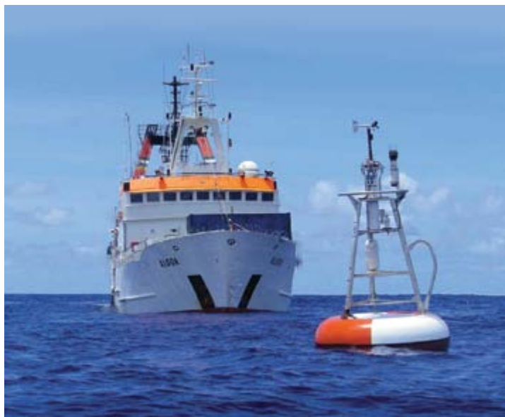
The South African research vessel, FRS Algoa , is pictured with an ATLAS mooring buoy, deployed by the National Oceanic and Atmospheric Administration of the USA to measure a suite of oceanographic and weather parameters and better understand the complex interaction between ocean and atmosphere and their role in climate change. The photograph aptly captures the strong partnerships between national governments and regional and international research agencies as well as the multidisciplinary research activities that have been defining features of the five year ASCLME Project.